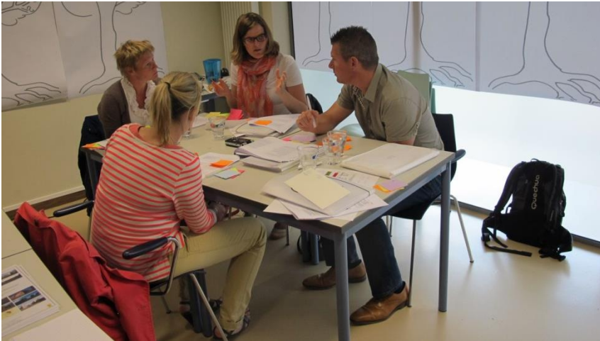
Focusgroep bijeenkomst huisartsen