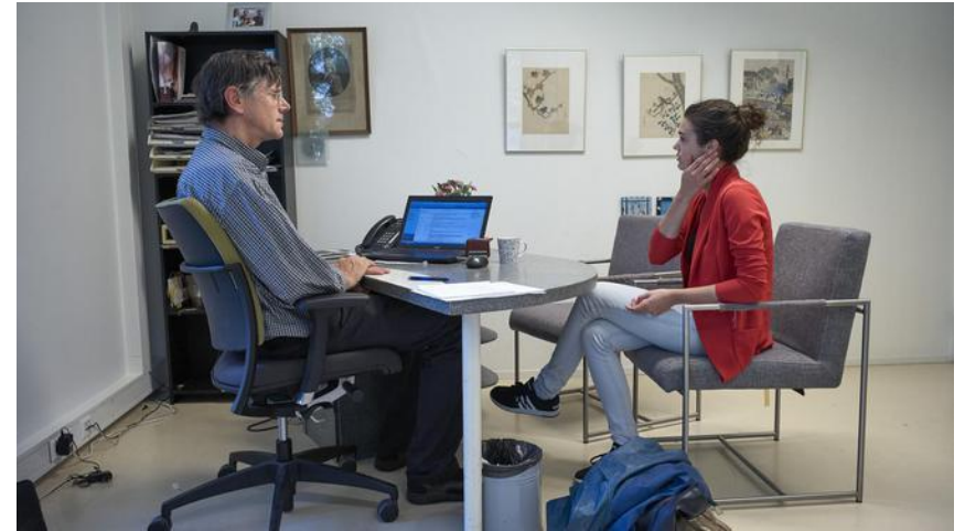
10 huisartsen (regio Leiden): toegang tot Medical Dashboard

Wat is de meerwaarde? Hoe ervaren de huisartsen het?